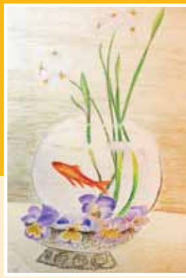
نمونه کار دانش آموزان مدرسه شاهد حضرت معصومه (س)

وقتی به دانش آموزان می‌گوییم با موضوع آزاد نقاشی کنند، متناسب با آن فکر می‌کنند و ذهنیات خود را روی کاغذ می‌آورند. در نتیجه آنچه را که در ذهن به صورت بالقوه دارند، بالفعل نشان می‌دهند. درس هنر کمک می‌کند که دانش آموزان در سایر درس‌هایشان پیشرفت کنند