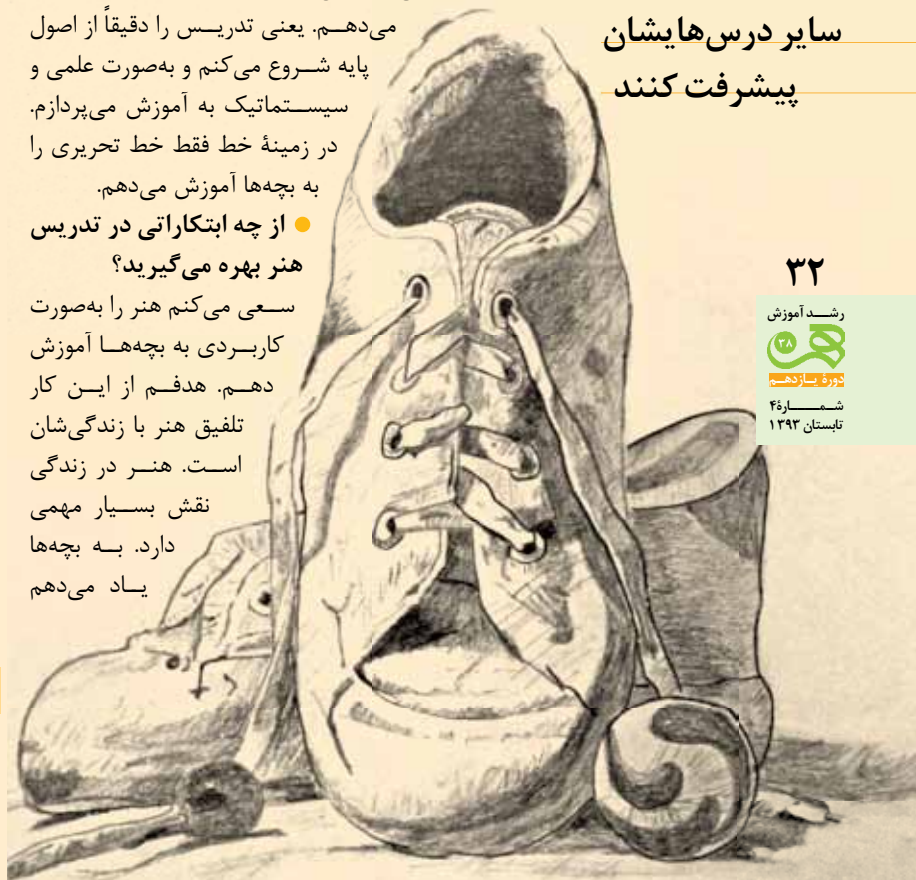
نمونه کار دانش آموزان مدرسه شاهد حضرت معصومه (س)

من از دبیران بسیار جدی هنر هستم. به طوری که همکارانم معتقدند که هنر را به اندازه دروس دیگر مانند ریاضی جدی گرفته‌ام. بله، من هنر را به اندازه درس ریاضی جدی گرفته‌ام. طوری با دانش آموزان برخورد کرده‌ام که همان اهمیتی را که به سایر درس‌هایشان می‌دهند، به درس هنر هم بدهند. البته ابتدا برای آن‌ها بسیار سخت است، ولی کم‌کم علاقه‌مند می‌شوند. برای خانواده‌ها هم سخت است. جبهه می‌گیرند و شکایت می‌کنند که چرا این قدر جدی